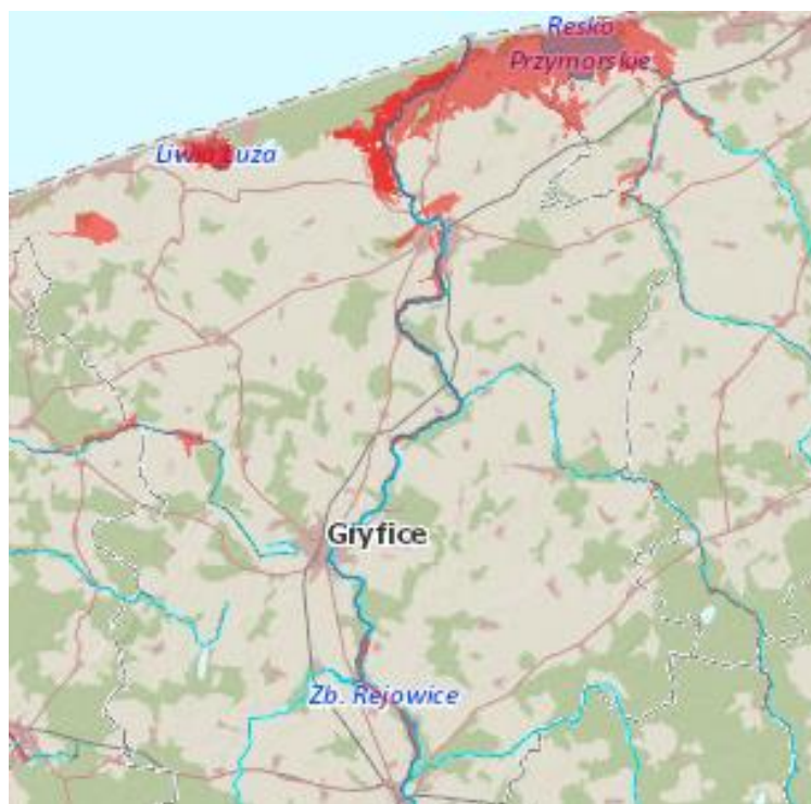
Rycina 3. Obszary najbardziej narażone na niebezpieczeństwo powodzi na terenie powiatu gryfickiego

Zgodnie z danymi Hydroportalu ISOK na terenie powiatu gryfickiego istnieje ryzyko zagrożenia powodziowego. Obszary szczególnego zagrożenia powodzią to obszary przybrzeżne: Rega, Przymorze od Regi do Parsęty, Przymorze od granicy państwa na wyspie Uznam do Regi, a także dolina Regi w okolicach Trzebiatowa, na odcinku powyżej Gryfic oraz w okolicach miasta Płoty.