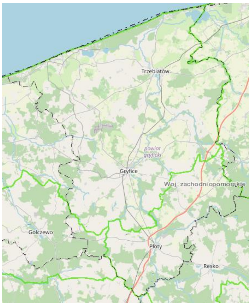
Rycina 5. Obszary leśne na terenie powiatu gryfickiego

Obszary zalesione na terenie powiatu gryfickiego przedstawia rycina poniżej.