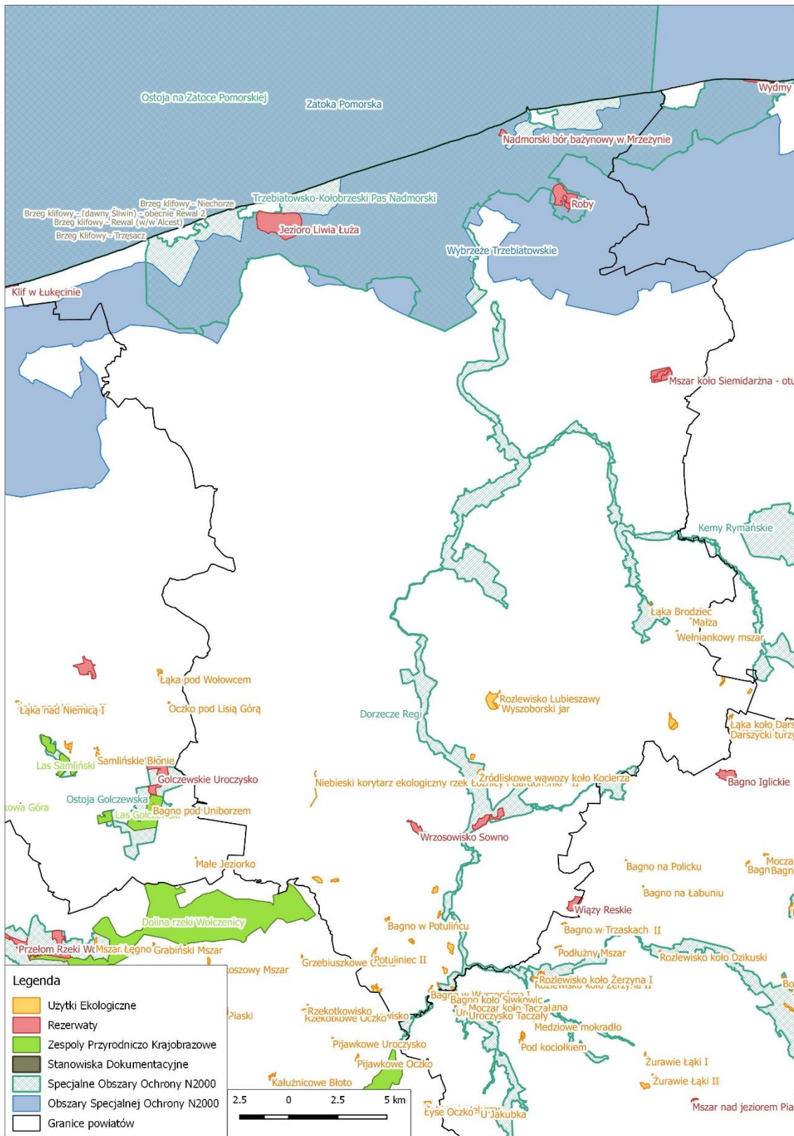
Rycina 4. Obszary chronione na terenie powiatu gryfickiego