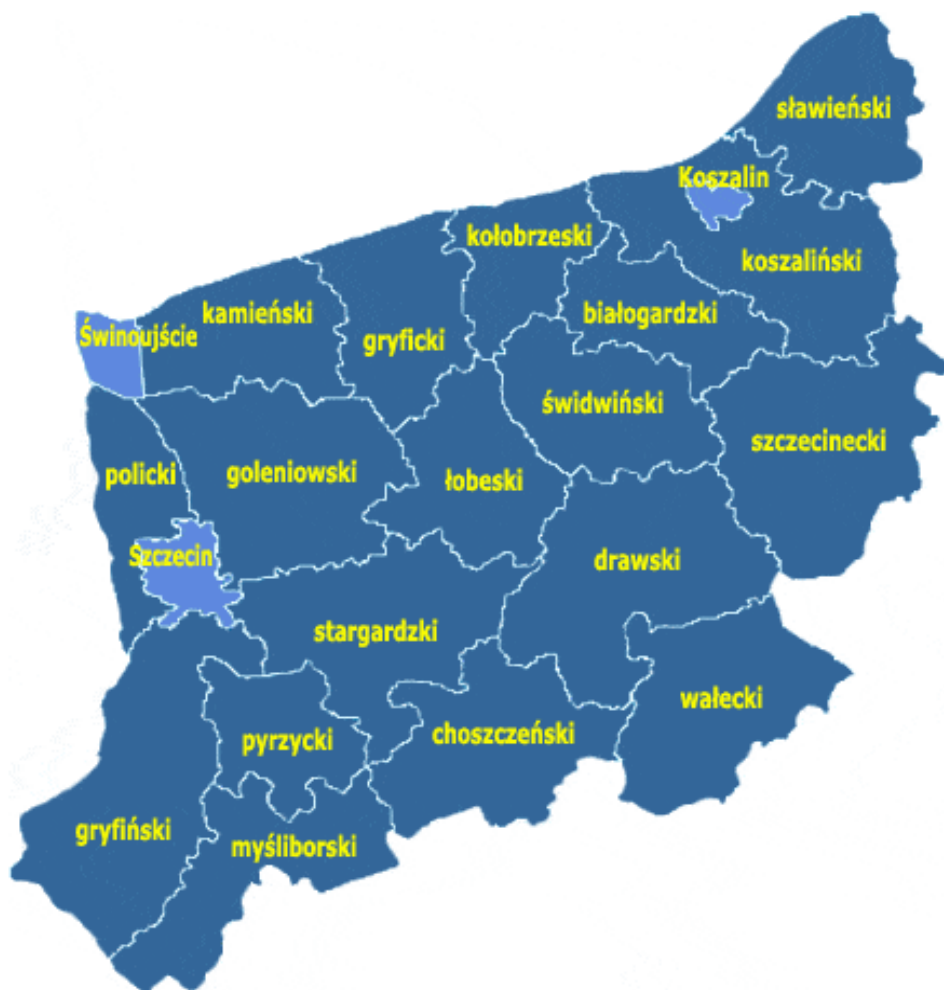
Rycina 1. Położenia powiatu na tle województwa zachodniopomorskiego

Granicę północną powiatu stanowi brzeg Morza Bałtyckiego (ok. 40 km), od wschodu powiat graniczy z powiatem kołobrzeskim, od południa z powiatem łobeskim, natomiast od zachodu z powiatem kamieńskim i goleniowskim.